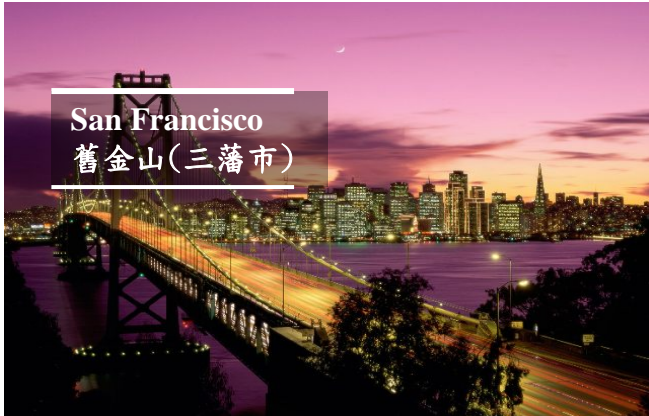
San Francisco 舊金山(三藩市)